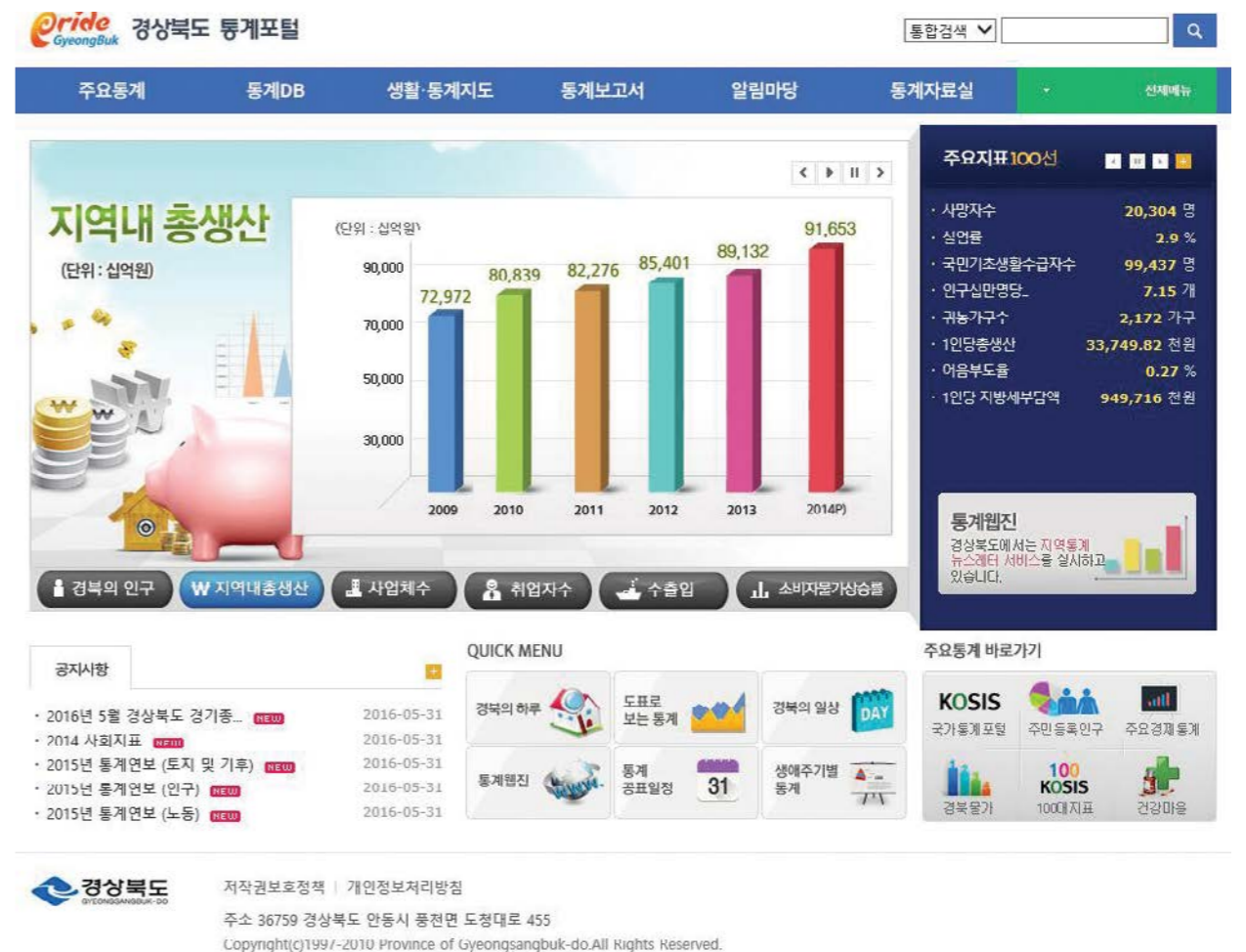
〈그림 3〉 경상북도 통계 포털