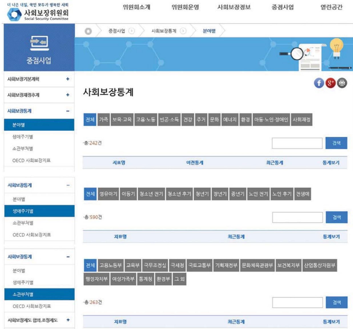
〈그림 2〉 사회보장위원회 사회보장통계정보시스템